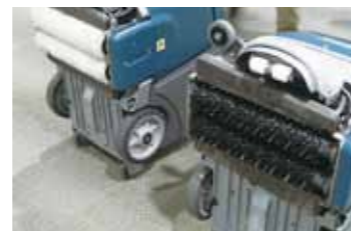
ReadySpace用ローラー(左)/アジャレーション用ブラシ(右)

R3はテナント社製カーペットクリーニングマシンです。ブラシで洗浄し、ナイロン繊維のローラーで拭き取る従来のない洗浄方式です。ブラシ洗浄と拭き取り洗浄のW効果で、ボンネット方式やオービタル方式では落とし切れなかった汚れを落とすことが可能です。また、洗剤をカーペットに直接噴霧しないので、洗浄後の乾燥が早いのも特徴です。マシンの準備にわずらわしさがなく、手軽に作業が出来ます。