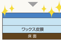
ベクトルダッシュ 1層塗布イメージ