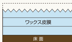
洗浄後の皮膜イメージ