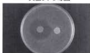
左:ユシロンコートHP/右:一般樹脂ワックス 左:ユシロンコートHP/右:一般樹脂ワックス

【写真の解説】1週間乾燥させたワックス皮膜(10mmφ)を、菌株を含む寒天培地にのせて30℃48hr培養した。抗菌剤を配合したユシロンコートHPには発育阻止円(ハロー)ができる。