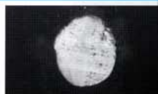
(一般樹脂ワックス)

【写真の解説】黒色ホモジニアスタイルにワックスを3層塗布し、室温で1日以上放置する。その上に手指消毒用エタノールを滴下し、30秒間放置後拭き上げる。ユシロンコートHPは白化せず元の状態のままである。